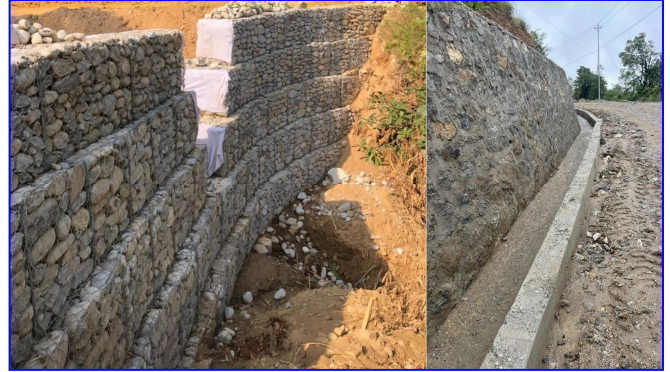
तस्विर: सडक सम्बन्धी निर्माण कार्यहरू, सिन्धुपाल्चोक