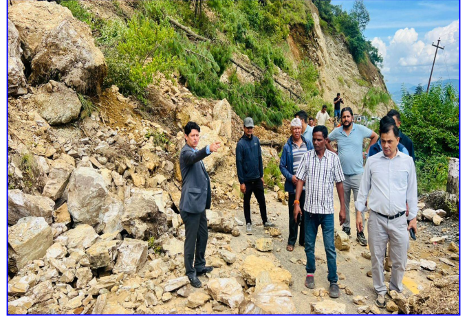
बिपदमा जनता संग ( आवागमन खुलाउन प्रयासरत)