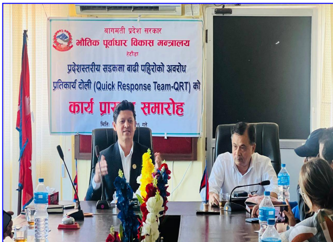
तस्बिर : द्रुत प्रतिकार्य टोली (QRT) गठन समारोह