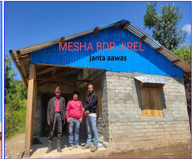
तस्विर: "जनता आवास कार्यक्रम" मार्फत सम्पन्न आवास