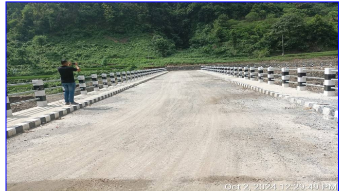
तस्विर: सडक पुल निर्माण, रामेछाप