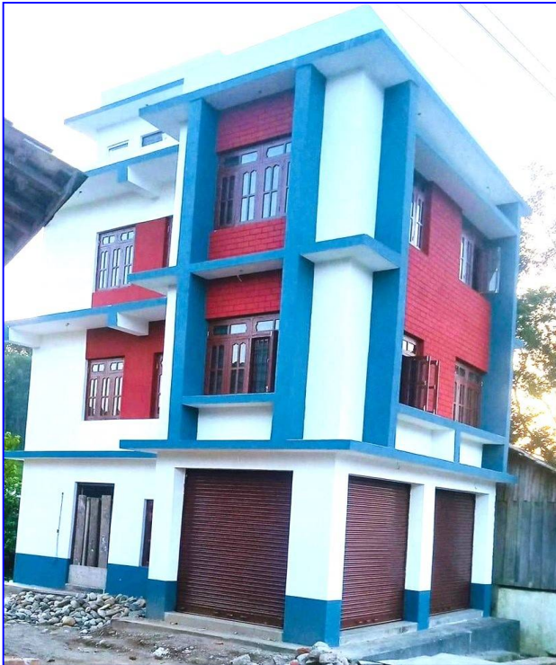
तस्विर: रेडक्रस भवन , सिन्धुली