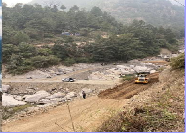
तस्विर: हेटौडा फाखेल फर्पिंड सडक अन्तर्गत हेभी, सिमखोला (कुलेखानी डयाममुनी) सडक डाईभर्सन निर्माण