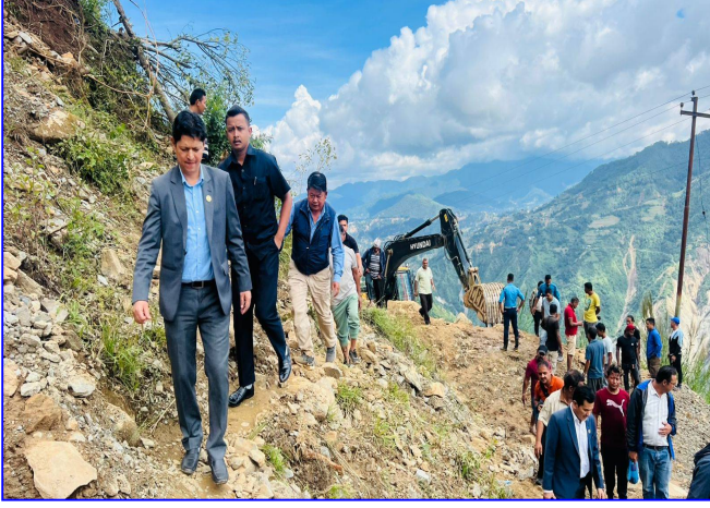
तस्विर: बिपदमा जनता संग (आवागमन खुलाउन प्रयासरत)