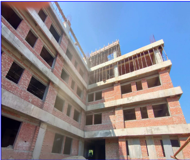
तस्विर: निर्माणाधीन हेटौडा अस्पताल, मकवानपुर