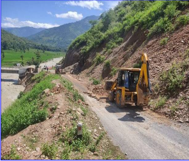
तस्विर: पहिरो हटाई आवागमन सुचारू गर्दै, रामेछाप