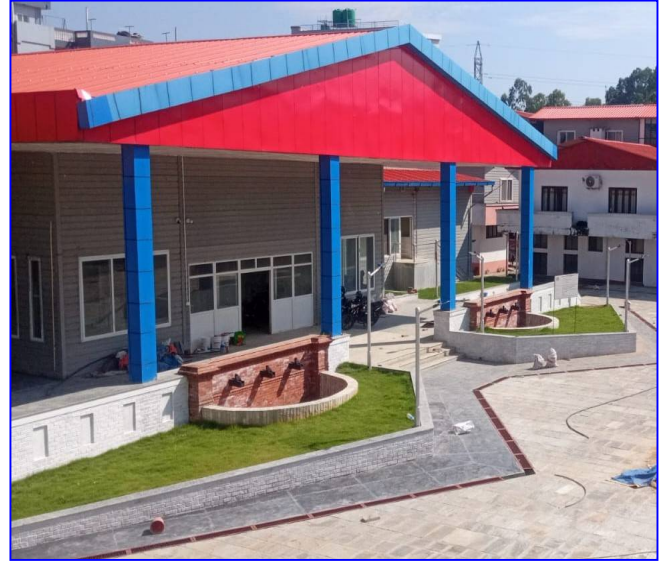
तस्विर: निर्माणाधीन "प्रदेश सभा हल", हेटौडा मकवानपुर